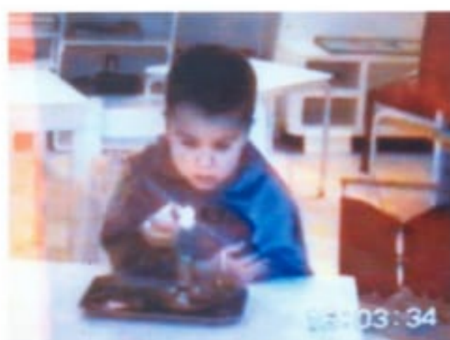
Lollo durante la fase di rifocalizzazione